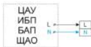
Рис. №2 Габаритный чертёж.